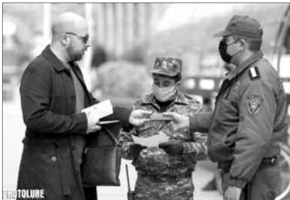
Число заразившихся коронавирусом в стране растет, принято решение продлить карантин еще на 30 дней: до 14 мая... Только вот на улицах и в магазинах самоизоляции и не пахнет.